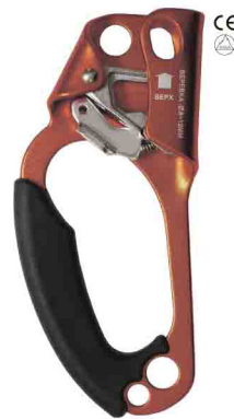
«ЖУМАР» ПОД ЛЕВУЮ РУКУ vpro 0084