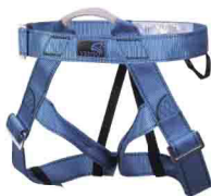
«ВЫСОТА 004» ПОЯСНАЯ БЕСЕДКА vst 004 Размеры: ---