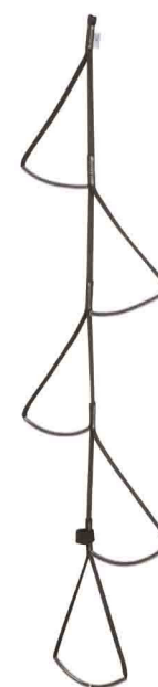
ЛЕСЕНКА ОБЛЕГЧЕННАЯ vnt 212