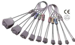
НАБОР ЗАКЛАДОК vpro 0135