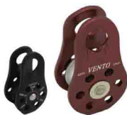
«СПАСАТЕЛЬ» vpro 0095