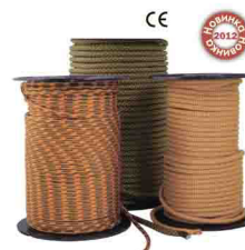
«CORD» \Phi 5, 6, 7, 8 мм ВСПОМОГАТЕЛЬНЫЕ ВЕРЕВКИ vnt 510