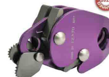
«КАПЛЯ ДВОЙНАЯ» vpro 0089