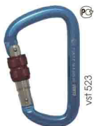
«ВЫСОТА 523» ТРАПЕЦИЕВИДНЫЙ С МУФТОЙ