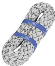
«ВЫСОТА 11» \Phi 11 мм (A) СТАТИЧЕСКАЯ ВЕРЕВКА Разрывная нагрузка: 24 kN vst 400 11