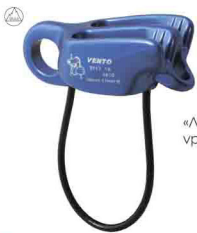
«ЛУКОШКО» vpro 0117