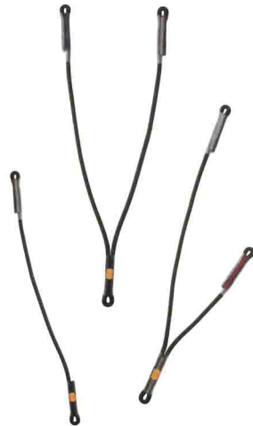
УСЫ ВЕРЕВОЧНЫЕ 50x50 см vnt 207 55 50x65 см vnt 207 56 50x80 см vnt 207 58 50x150 см vnt 207 515 65x65 см vnt 207 66 80x80 см vnt 207 88 50 см vnt 206 50 75 см vnt 206 75 100 см vnt 206 100 150 см vnt 206 150