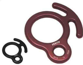
«ВОСЬМЕРКА РОГАТАЯ» vpro 0114