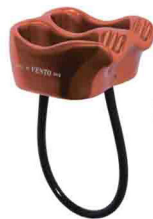
«КОРЗИНКА» vpro 0112