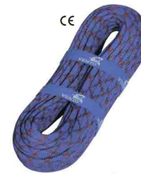
«STATIC 10» \Phi 10 мм СТАТИЧЕСКАЯ ВЕРЕВКА Разрывная нагрузка: 30 kN vnt 500 10