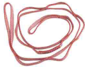
ПЕТЛЯ DAISY CHAIN «ЭКСТРА» Длина: 110/135 см vnt 250 110/135