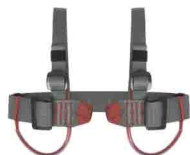
ГРУДНАЯ «МОДИФИЦИРОВАННАЯ» vnt 001 Размеры: ---