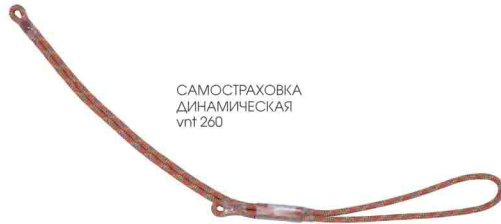
САМОСТРАХОВКА ДИНАМИЧЕСКАЯ vnt 260