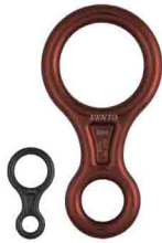
«ВОСЬМЕРКА КЛАССИЧЕСКАЯ» vpro 0111