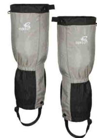
ГАМАШИ vnt 248