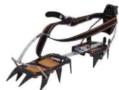
КОШКИ ЖЕСТКИЕ vpro 0162