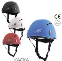
КАСКА vpro 0200 Размер: 53-61 см