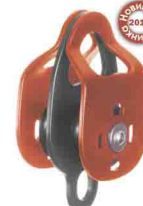
«DOUBLE» ДВОЙНОЙ С ПОДШИПНИКОМ vpro 0192