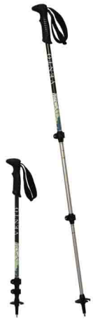
ПАЛКИ ТРЕККИНГОВЫЕ С ПРОРЕЗИНЕННОЙ РУЧКОЙ vpro 0165gr