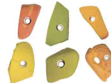
ЗАЦЕПКИ В АССОРТИМЕНТЕ Размеры: XS/S/M/L/XL/XXL/XXXL vnt 83 0/1/2/3/4/5/6