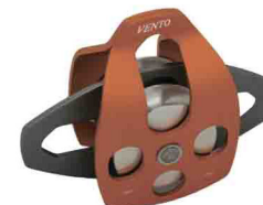
ДВОЙНОЙ «ЛЮКС» vpro 0092