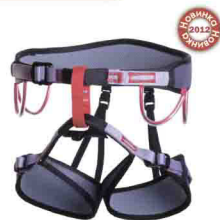
NEON vnt 106 Размеры: XS, S, M, L, XL