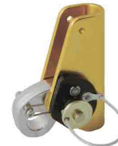
«ПРОМАЛЬП» vpro 0082