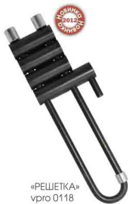
«РЕШЕТКА» vpro 0118