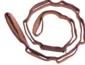
ПЕТЛЯ DAISY CHAIN «ЛЮКС» Длина: 110/135 см vnt 205 110/135