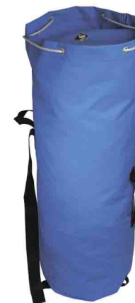
БАУЛ ТРАНСПОРТНЫЙ 30/45/60/80 л vnt 231 30/45/60/80