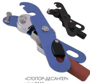
«СТОПОР-ДЕСАНТЕР» vpro 0113