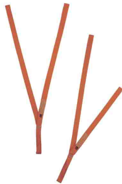
УСЫ ЛЕНТОЧНЫЕ «СТАНДАРТ» 40x60 см vnt 251 46 60x80 см vnt 251 68 80x80 см vnt 251 88