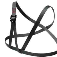
ПОДДЕРЖКА КРОЛЯ vnt 216 Размеры: ---