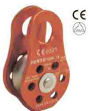
«СПАСАТЕЛЬ - ЛЮКС» vpro 0099