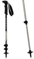
ПАЛКИ ТРЕККИНГОВЫЕ С ПРОРЕЗИНЕННОЙ РУЧКОЙ vpro 0165gr