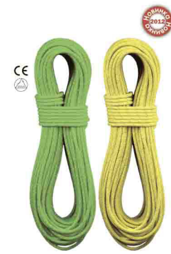
«GURU» \Phi 8,3 мм ДИНАМИЧЕСКАЯ ВЕРЕВКА Дин. удлинение: @29,6% @32,8% Стат. удлинение: @5,4% @9,2% Кол-во рывков: @16 @5 vnt 550