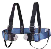
«ВЫСОТА 001» ГРУДНАЯ ОБВЯЗКА vst 001 Размеры: ---