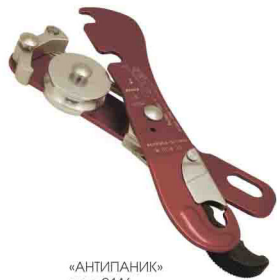
«АНТИПАНИК» vpro 0116