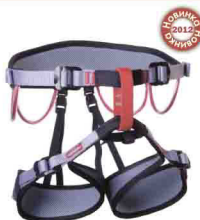
ARGON vnt 108 Размеры: 1, 2