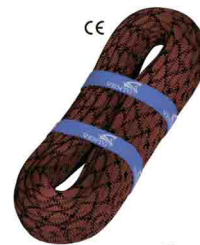
«STATIC 11» \Phi 11 мм СТАТИЧЕСКАЯ ВЕРЕВКА Разрывная нагрузка: 32 kN vnt 500 11