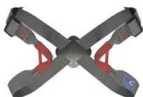
ГРУДНАЯ «БАБОЧКА РЕГУЛИРУЕМАЯ» vnt 003 Размеры: ---