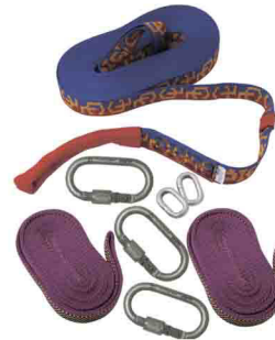
СЛЭКЛАЙН ПОЛНЫЙ КОМПЛЕКТ «МАСТЕР» vnt 817 Длина: 15/25 м СТРОПА И ЗВЕНЬЯ vnt 817 it Длина: 15/25 м