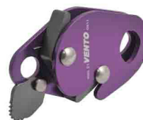
«КАПЛЯ» vpro 0085