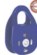
«SINGLE» ОДИНАРНЫЙ С ПОДШИПНИКОМ vpro 0191