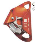
«КРОЛЬ» vpro 0086