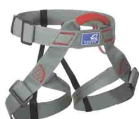
ПОЯСНАЯ «СТАНДАРТ» vnt 004 Размеры: ---