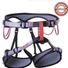
XENON vnt 109 Размеры: 1, 2