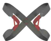
ГРУДНАЯ «БАБОЧКА» vnt 002 Размеры: 0, 1, 2