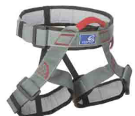
ПОЯСНАЯ «ЛЮКС» vnt 005 Размеры: ---