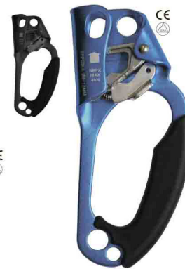
«ЖУМАР» ПОД ПРАВУЮ РУКУ vpro 0083