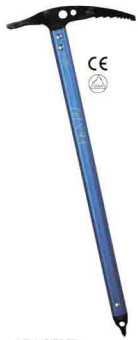
ЛЕДОРУБ 60 см vpro 0120 60 65 см vpro 0120 65 70 см vpro 0120 70 75 см vpro 0120 75 80 см vpro 0120 80