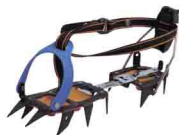
КОШКИ ПОЛУЖЕСТКИЕ vpro 0161