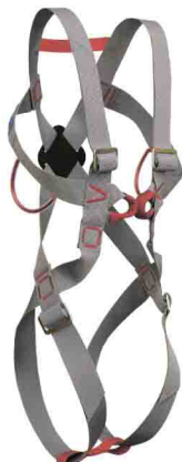
«УНИВЕРСАЛЬНАЯ СТАНДАРТ» ГОСТ Р ЕН 361-2008 vnt 011 Размеры: ---