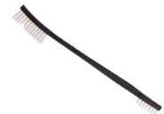
ЩЕТКА ДЛЯ ЗАЦЕПОВ vnt 828