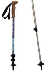
ПАЛКИ ТРЕККИНГОВЫЕ С ПСЕВДОПРОБКОВОЙ РУЧКОЙ vpro 0165bl