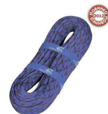
«PRO 10» \Phi 10 мм СТАТИЧЕСКАЯ ВЕРЕВКА Разрывная нагрузка: 31 kN vnt 530 10