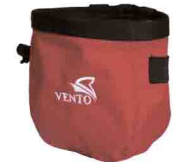
МЕШОЧЕК ДЛЯ МАГНЕЗИИ vnt 247