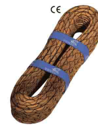
«STATIC 9» \Phi 9 мм СТАТИЧЕСКАЯ ВЕРЕВКА Разрывная нагрузка: 25 kN vnt 500 09