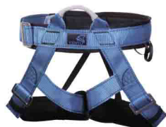
«ВЫСОТА 005» ПОЯСНАЯ БЕСЕДКА vst 005 Размеры: ---