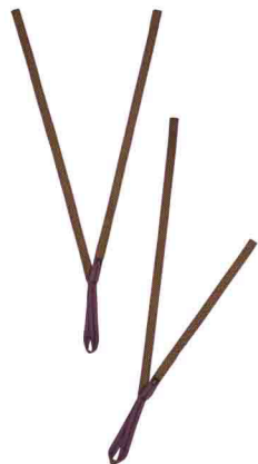
УСЫ ЛЕНТОЧНЫЕ «ЛЮКС» 40x60 см vnt 252 46 60x80 см vnt 252 68 80x80 см vnt 252 88