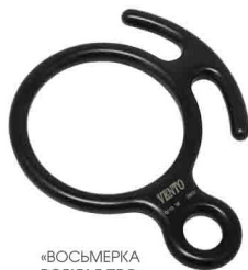
«ВОСЬМЕРКА РОГАТАЯ ПРО» vpro 0110