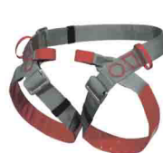
СПЕЛЕО «СТАНДАРТ» vnt 010 Размеры: 1, 2