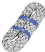
«ВЫСОТА 9» \Phi 9 мм (B) СТАТИЧЕСКАЯ ВЕРЕВКА Разрывная нагрузка: 19 kN vst 400 09