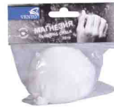
МАГНЕЗИЯ В ШАРИКЕ 56 гр - vnt 815 35 гр - vnt 818