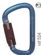
«ВЫСОТА 524» ТРАПЕЦИЕВИДНЫЙ С БАЙОНЕТНОЙ МУФТОЙ