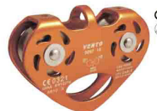
«ТАНДЕМ - ЛЮКС» vpro 0097