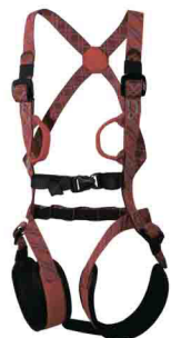
«ДЕТСКАЯ УНИВЕРСАЛЬНАЯ» vnt 031 Размеры: ---