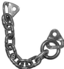
ШЛЯМБУРНЫЕ УШИ С ЦЕПЬЮ Φ 10/12 ОЦИНКОВКА vpro 0145/0146 Φ 10/12 НЕРЖАВЕЙКА vpro 0155/0156