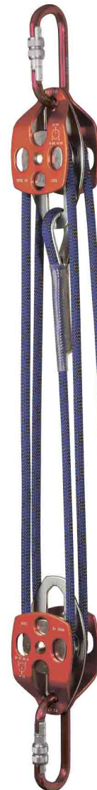
ПОЛИСПАСТ vnt 910 Рабочая длина: 3.5 м