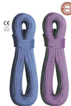
«ФАКТОР» \Phi 10 мм ДИНАМИЧЕСКАЯ ВЕРЕВКА Дин. удлинение: 33% Стат. удлинение: 7,9% Кол-во рывков: 7 vnt 551