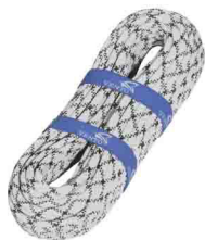
«ВЫСОТА 12» \Phi 12 мм (A) СТАТИЧЕСКАЯ ВЕРЕВКА Разрывная нагрузка: 31 kN vst 400 12