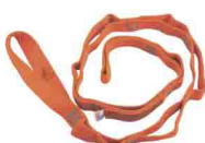
ПЕТЛЯ DAISY CHAIN «СТАНДАРТ» Длина 110/135/180 см vnt 204 110/135/180