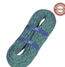
«PRO 11» \Phi 11 мм СТАТИЧЕСКАЯ ВЕРЕВКА Разрывная нагрузка: 32 kN vnt 530 11