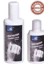
МАГНЕЗИЯ ЖИДКАЯ 100 мл - vnt 820 200 мл - vnt 821