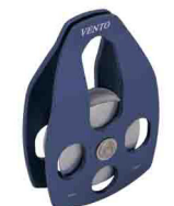
ОДИНАРНЫЙ «ЛЮКС» vpro 0093