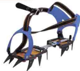
КОШКИ МЯГКИЕ vpro 0160