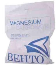
МАГНЕЗИЯ В ПАКЕТЕ 440 гр vnt 816