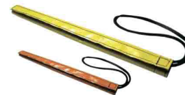
ПРОТЕКТОР ДЛЯ ВЕРЕВКИ СТАНДАРТНЫЙ 35 см vnt 217 35 УВЕЛИЧЕННЫЙ 75 см vnt 217 75